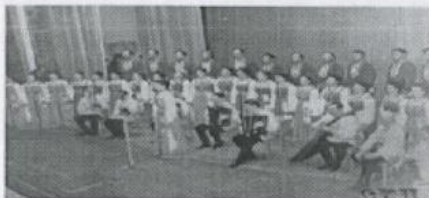
Рисунок 1 – Народный хор Шиллера