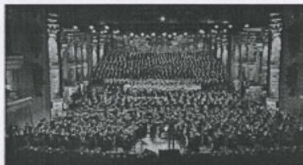
Рисунок 3 – Камерный хор Павлодарской области на ЕХРО-2017

В число участников проекта вошли ведущие казахстанские хоровые коллективы, среди которых были и Камерный хор Павлодарской областной филармонии им. Исы Байзакова.